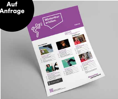
«Halten Sie Ihre Gäste stets auf dem Laufenden, was in Winterthur läuft.»