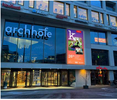
«Präsent direkt am Bahnhof Winterthur.»